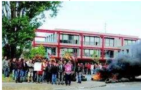
Les salariés manifestent devant les nouveaux locaux Véolia.

Mardi matin, plus de 50 % des salariés de Véolia Eau Boulogne se sont mis en grève dès 6h du matin. Leurs revendications portent sur les salaires et le respect des employés.